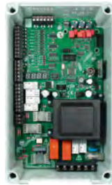
Typ M64 plus

Den elektroniska manövreringen kan programmeras för att passa varje projekt eller kundens särskilda krav. Ett brett valbart sortiment erbjuder: induktionsslinga-detektering, fotoceller, nyckelbrytare, radiostyrd fjärrkontroll, kortläsare, knappsats, myntinkast.